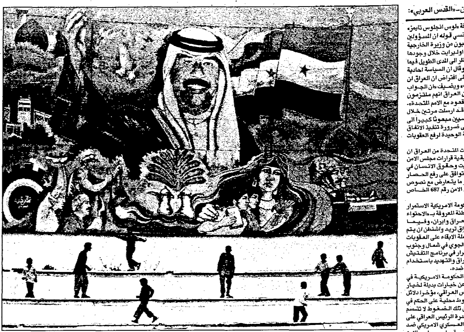
اطفال يلعبون امام صورة كبيرة للرئيس العراقي في بغداد